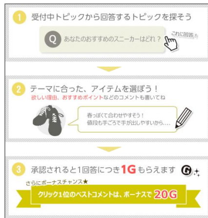
「Gランキング」投稿画面

「Gランキング」では、自分の欲しいものや気になる商品を投稿することを楽しみながら、他の会員から投稿された情報により、知識や知見を高めていくことが可能です。