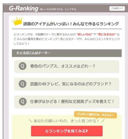
「Gランキング」サイトイメージ

「Gランキング(ジー・ランキング)」( http://pmall.gpoint.co.jp/g-ranking/ )は、話題のジャンルやトレンド情報など、さまざまなトピック(質問)に対して、みんなが「欲しい」「気になる」「おすすめ」と思う商品情報の投稿(回答)を集め、ランキング形式で紹介するQ&A型のキュレーションサービスです。